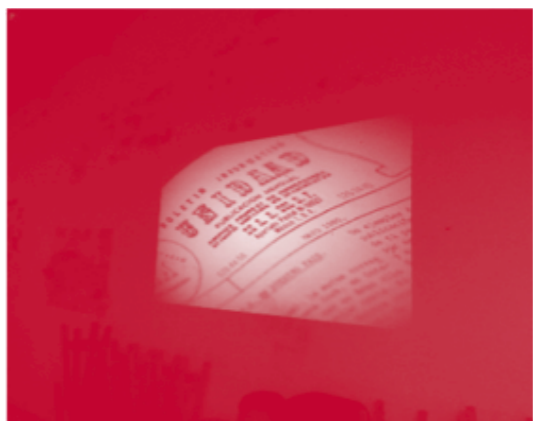
Boletín Unidad de la Oficina Intergrupala del D. F.

El evento inició con el registro de asistentes y un almuerzo, durante el cual se proyectaron videos con imágenes históricas de AA.